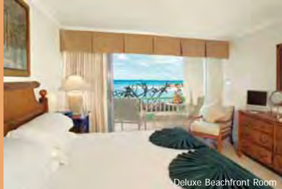
Deluxe Beachfront Room