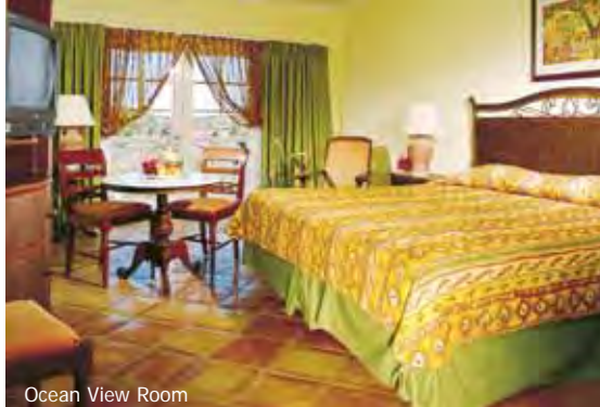
Ocean View Room