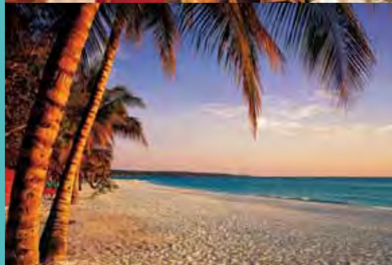
Beach Front Suite